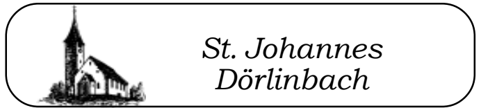
St. Johannes Dörlinbach

Der Weltgebetstag der Frauen findet in diesem Jahr in Schweighausen statt. Beginn: 19.00 Uhr. Alle Frauen der Seelsorgeeinheit sind herzlich eingeladen.